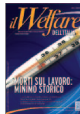
Il Welfare dell'Italia ANNO IV NUMERO 17 GIUGNO 2009