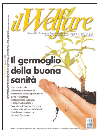
Il Welfare dell'Italia Anno 2 Numero 6 settembre 2007 Contiene il Supplemento "Il Welfare del Piemonte"